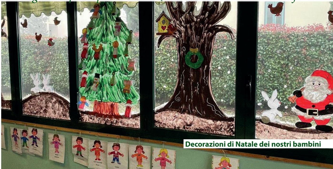
Decorazioni di Natale dei nostri bambini

È già tempo di primi bilanci, ma l'entusiasmo è ancora forte