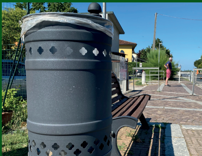
Svuotamento settimanale dei cestini