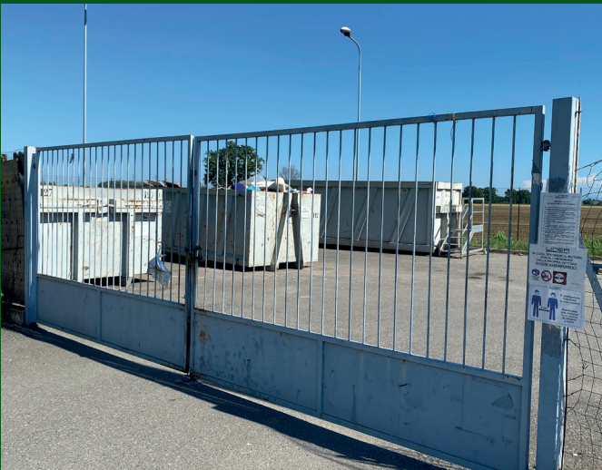
L'ingresso della piazzola ecologica