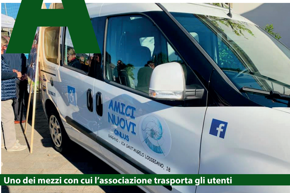
Uno dei mezzi con cui l'associazione trasporta gli utenti

I loro mezzi non si sono mai fermati, ma ora, grazie alla nuova convenzione sottoscritta con il Comune, hanno una marcia in più. Amici Nuovi è un'associazione attiva sul territorio di Villanova e Bargano da quindici anni, durante i quali si è occupata prevalentemente del trasporto di persone con disabilità verso strutture scolastiche e di lavoro, e del trasporto di anziani verso strutture sanitarie, oltre che di raccolte fondi da devolvere ad enti e associazioni in difficoltà.