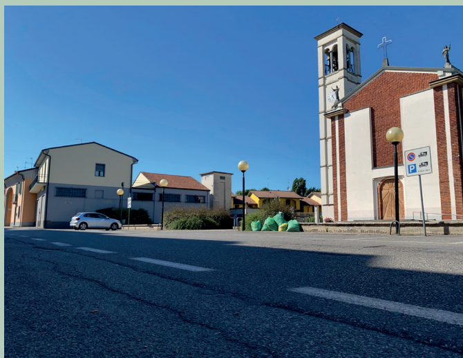
Strade più pulite