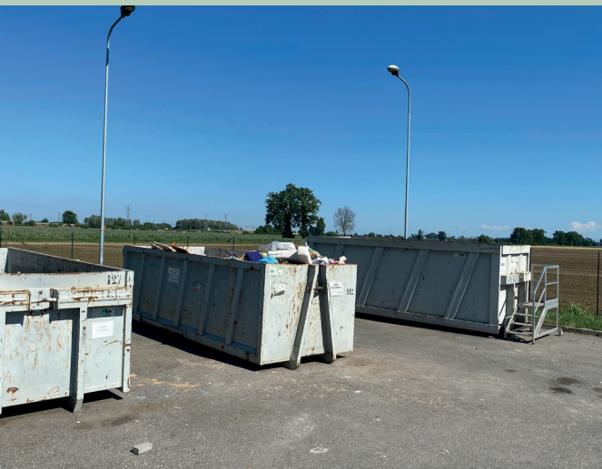
La piazzola ecologica di Villanova