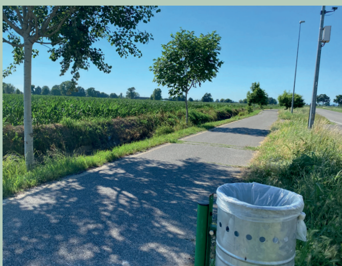
La ciclabile di Bargano