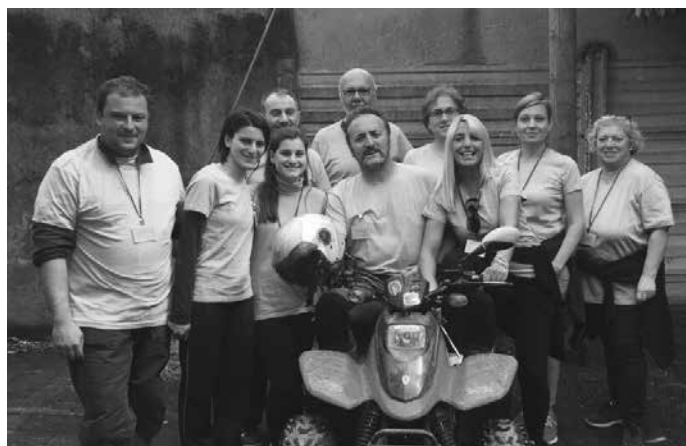
I volontari dell'organizzazione

ATTENZIONE: segnaliamo che i campi che si trovano nel territorio comunale e quelli in altri Comuni, sono di proprietà privata, quindi per entrare (come è stato fatto per la corsa podistica) bisogna chiedere l'autorizzazione.