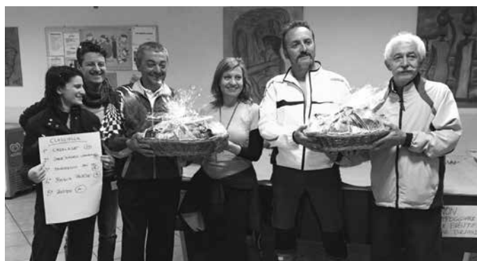
I premiati della corsa