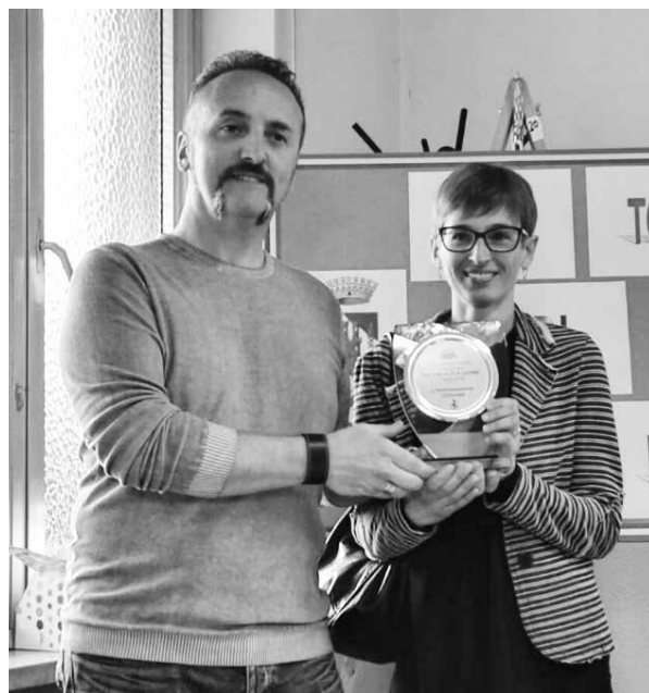
La vincitrice del concorso "La torta di S. Leone"