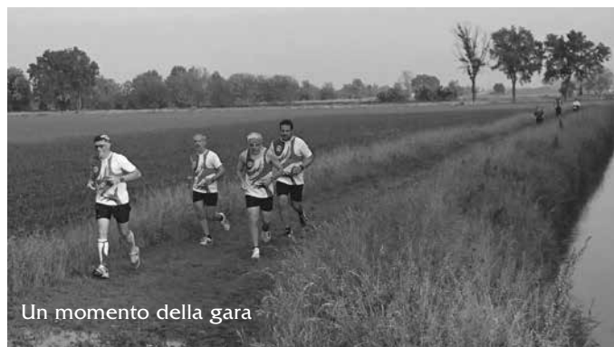
Un momento della gara

Un ringraziamento agli organizzatori e a tutti i volontari che stazionavano agli incroci, ai punti di ristoro e al rinfresco dell'arrivo.