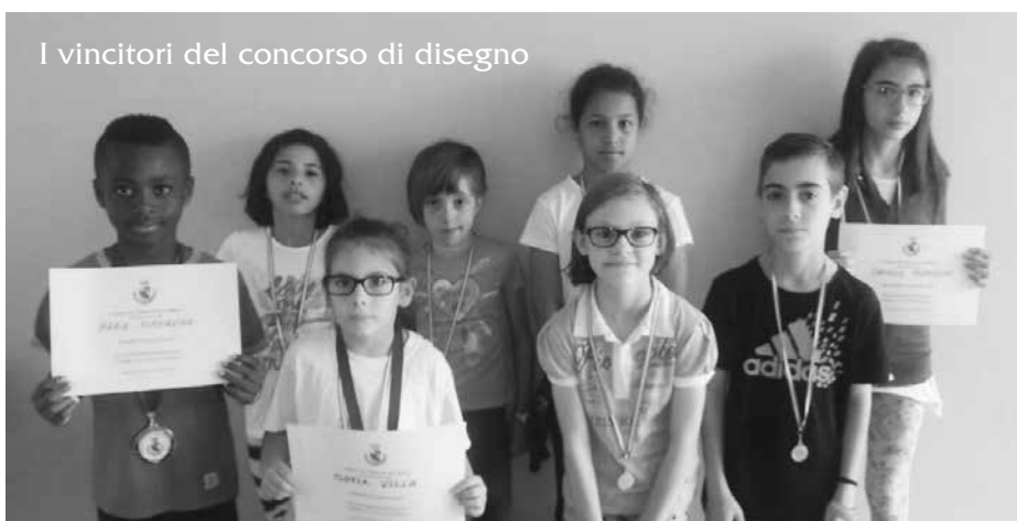
I vincitori del concorso di disegno