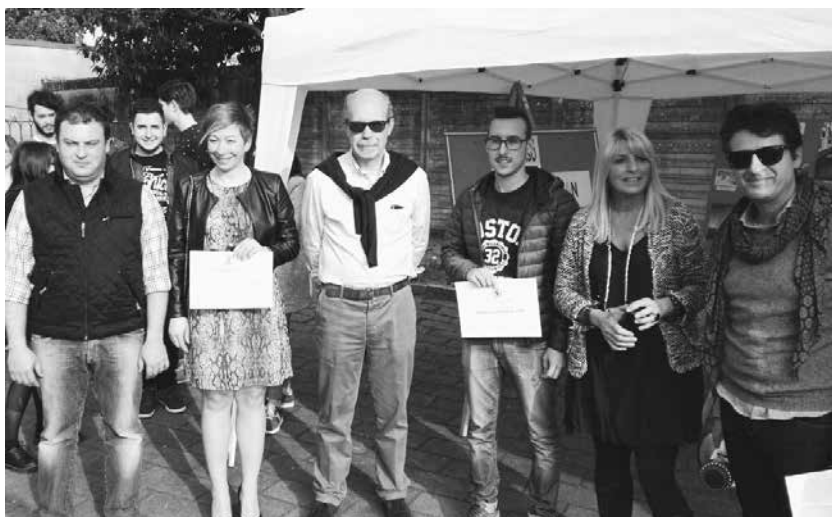
I vincitori del concorso fotografico

Nella giornata di domenica, complice il bel tempo, i barganesi hanno gironzolato tra le bancarelle di artigianato e delle associazioni (Aido, Amici del Borio e Amici nuovi). Gli ospiti di Cascina Ressa (Maiano) hanno venduto alimenti di loro produzione, mentre un'esposizione di automobili tuning (modificate rispetto agli standard di serie) ha attirato l'attenzione di grandi e piccoli che per tutta la giornata hanno potuto divertirsi sulle giostre e sui gonfiabili allestiti in via Sant'Angelo, di fronte alla chiesa parrocchiale. Buoni i risultati della pesca benefica che si è conclusa lunedì sera in oratorio, dopo la tradizionale processione per le vie del paese con la statua del patrono San Leone. Anche la vendita a prezzo simbolico di libri "doppi" della biblioteca ha avuto discreto successo: una cinquantina di testi sono stati acquistati e il ricavato verrà investito in nuove pubblicazioni messe a disposizione dal servizio di prestito.