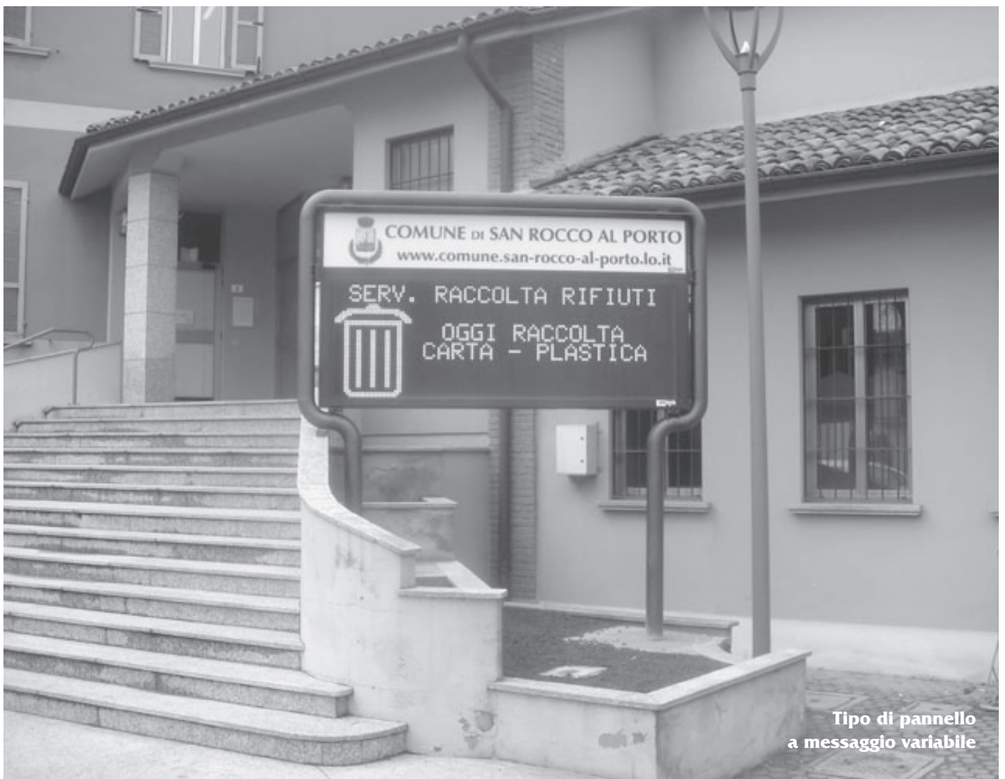
Tipo di pannello a messaggio variabile